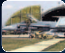
دعم دورة الحياة ودمج التقنية