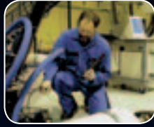
الصيانة والدعم اللوجستي