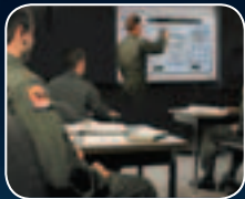
التعليم في القاعات الدراسية وأجهزة المحاكاة