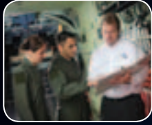
تحليل احتياجات التدريب