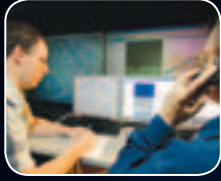
تصميم النظام التعليمي