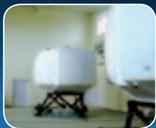
أجهزة المحاكاة والتدريب على المهام الكاملة